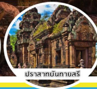
ปราสาทบันทายศรี