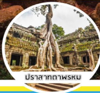
ปราสาทตาพรหม